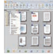
Das PaperPort SE14 Vollbild

Die professionelle Wahl Dokumente zu organisieren und zu teilen