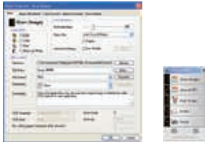
Das Button Manager V2 Vollbild