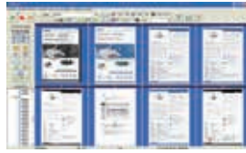
Das AVScan X Vollbild

Das intelligente Dokumenten Management Tool