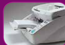
Mittlere Position (300 Blatt)