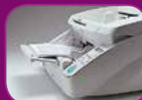
Höchste Position (100 Blatt)

Der automatische Dokumenteneinzug bietet drei Zufuhrmodi (100, 300 und 500 Blatt), die je nach Auftragsumfang angepasst werden können und so Zeit sparen und den Durchsatz steigern.