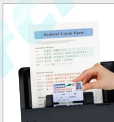
Unterschiedliche Dokumententypen, in einem Scanvorgang, scannen