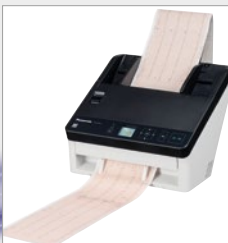
Lange Papierformate scannen

ALLE SCHWARZWEISS- ODER FARBDOKUMENTE KÖNNEN MIT EINER AUFLÖSUNG VON 200 ODER 300 DPI IN DERSELBEN GESCHWINDIGKEIT GESCANTT WERDEN, WAS DIE PRODUKTIVITÄT IHRES UNTERNEHMENS IMMENS STEIGERT.