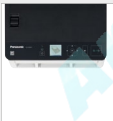
Mit nur einem Tastendruck scannen