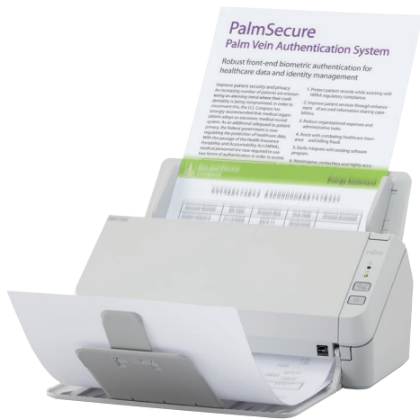
Zuverlässige Scanlösung für jeden Tag